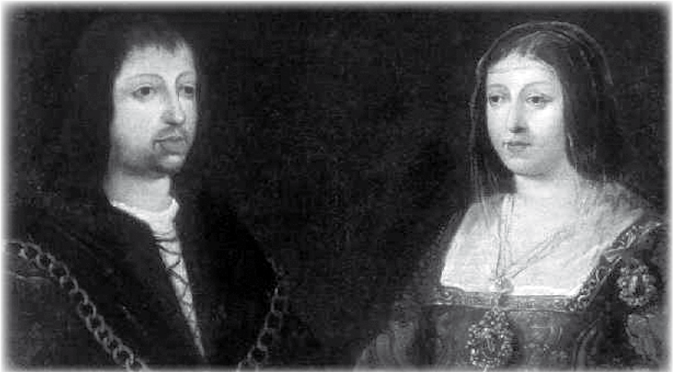
(4) Gaztela-ko I Isabel 1.451-1.504. (5) Aragoi-ko II Fernando 1.452-1.516.

Eta emendik aurrera Fernando ta Isabel-ek, bialtzen ebezan eskutitz, agiri, norberaren agiri, lege